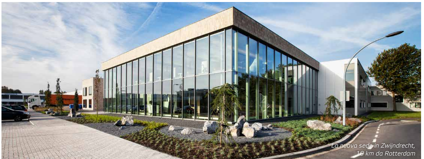
La nuova sede in Zwijndrecht, 10 km da Rotterdam